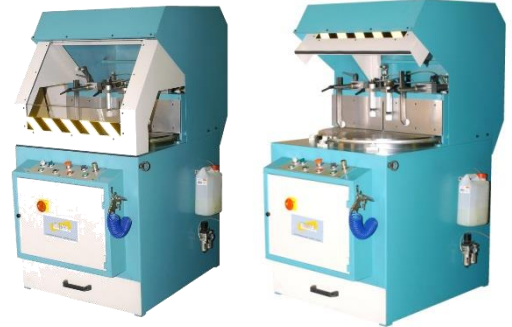
Diagramma di taglio SGO – R con lama diam. 550 mm

Sistema di staffaggio pezzo multiplo La segatrice SGO -R è dotata di un sistema pneumatico di bloccaggio pezzo tramite cilindri verticali ed orizzontali che garantiscono un efficace e sicuro serraggio del pezzo da tagliare, anche nel caso di profili con sezioni elevate. La posizione dei cilindri pressori è regolabile nello spazio.