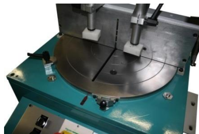
Tavola orizzontale orientabile

La segatrice SGF400 è dotata di un ampio piano di appoggio orizzontale in ferro che garantisce la massima robustezza e precisione in fase di caricamento e bloccaggio del pezzo da tagliare.